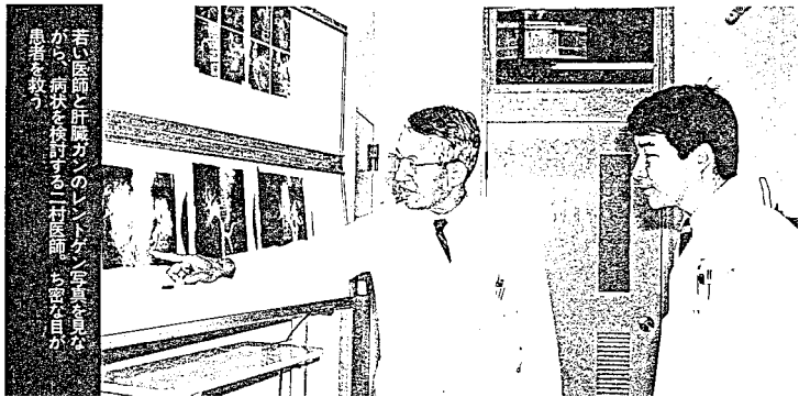
若い医師と肝臓ガンのレントゲン写真を見ながら病状を後述する二村医師ら密に目の患者を救う

残念なのは、3人の男の子のだけでも柔道をやってくれないこと。「痛いからいやだなんて言うんです。仕方ないですね」